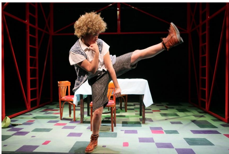
EET JE BORD LEEG