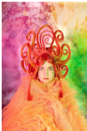
DE TOVERFLUIT