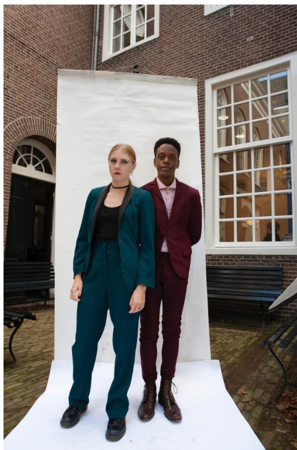
ACHTER DE SCHERMEN MIJN MOEDER MEDEA

Na afloop van de voorstelling wordt de klas omgebouwd. In elke hoek van de klas staat een rollbanner met daarop levensgroot een afbeelding van een van de personages van het stuk: Jason, Medea, Polyxeinos en Eriopis. Leerlingen antwoorden vragen door bij een personage te gaan staan, ook de leerlingen die niet graag praten denken en doen zo mee. Het begint makkelijk: met wie zou jij wel eens een koffietje willen drinken en het eindigt ingewikkelder: wie heeft er schuld? Leerlingen praten over vechtscheidingen, loyaliteit naar je vader en je moeder, een vreemde zijn in het land waar je woont en hoe ga je om met verlies.