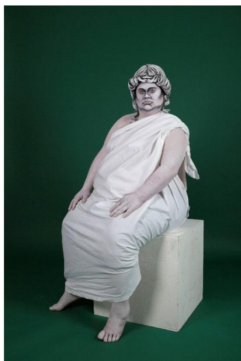
DOWN UNDERGROUND