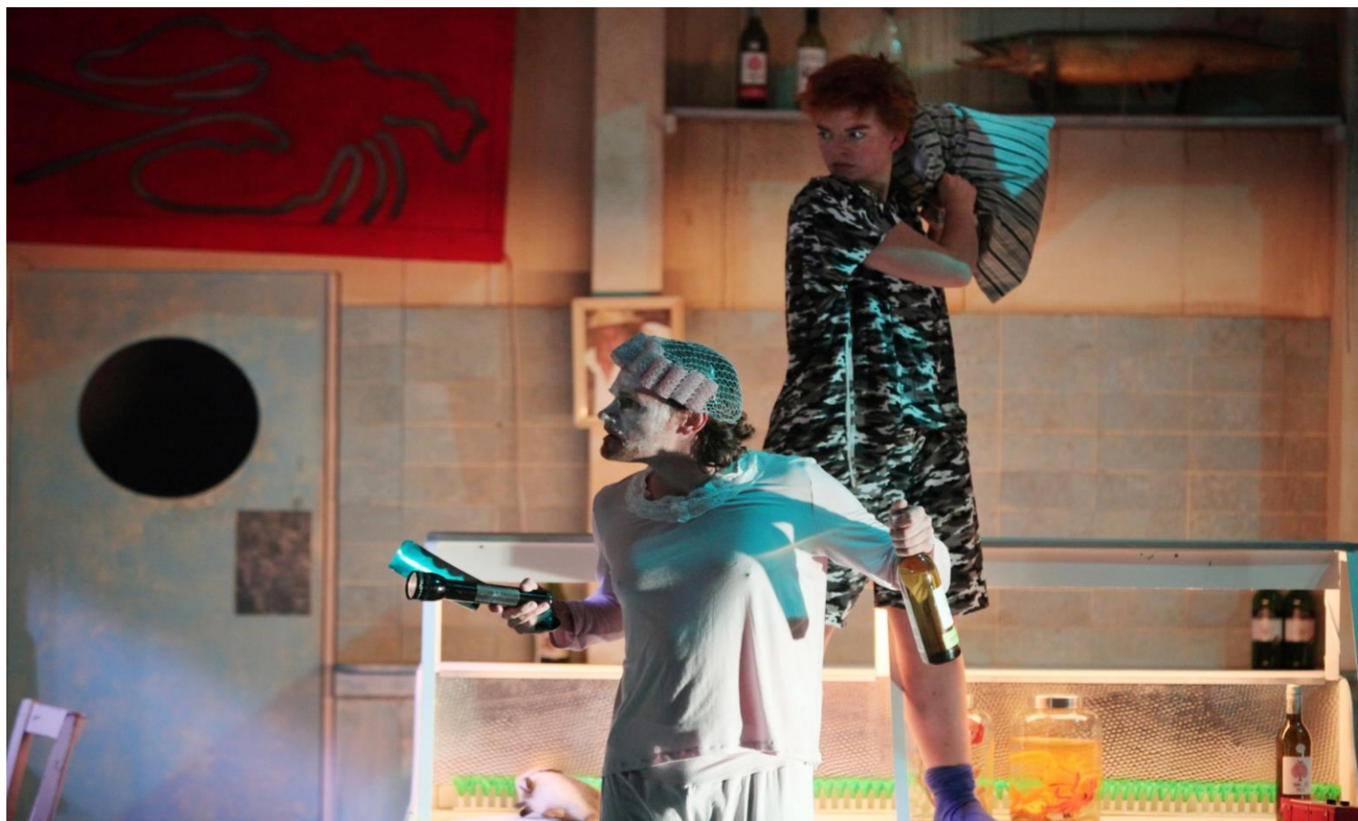
De tantes