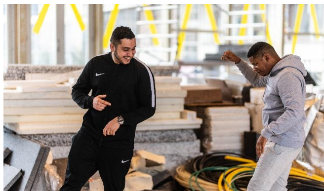
HAMLET REPETITIE

De samenstelling van het bestuur bleef gelijk. De voorzitter kondigde aan dat hij binnen afzienbare tijd het stokje wil overdragen. Op basis van een vast te stellen profiel zal een opvolger geworven worden, waarbij de Code Diversiteit en Inclusie richting geeft.