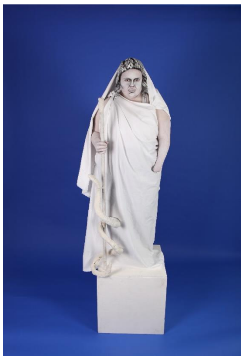
DOWN UNDERGROUND

Binnen Podiumkids hebben we ons samen met 26 gezelschappen verenigd om jeugdpodiumkunsten collectief onder aandacht te brengen van een nieuw en breed publiek. Via Podiumkids Thuis speelden we in op de coronasituatie waarin kinderen niet naar het theater konden, maar thuis via dit platform van theater konden genieten.