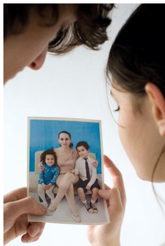
MIJN MOEDER MEDEA © ESTER DE BOER