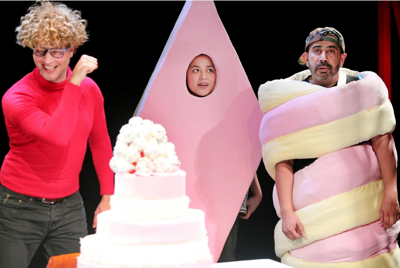
EET JE BORD LEEG