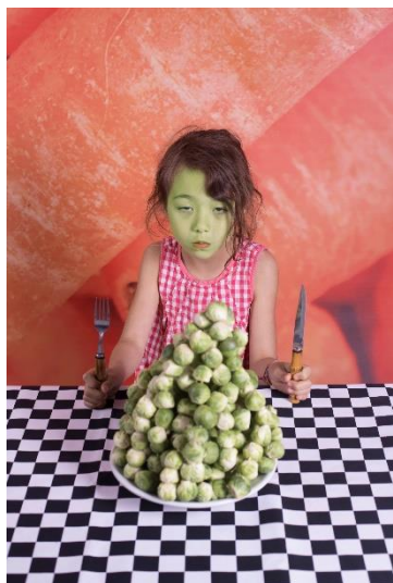
EET JE BORD LEEG