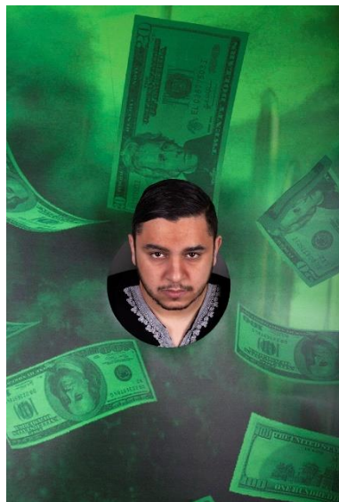
HAMLET © JAN HOEK