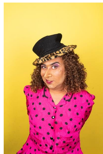
DE TANTES © JAN HOEK