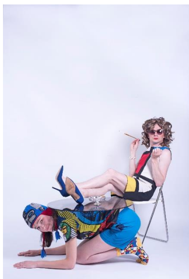
MIJN MOEDER IS EEN DIVA © JAN HOEK