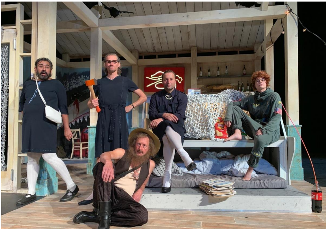
ACHTER DE SCHERMEN DE TANTES