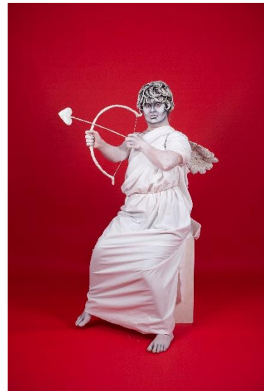
DOWN UNDERGROUND © JAN HOEK