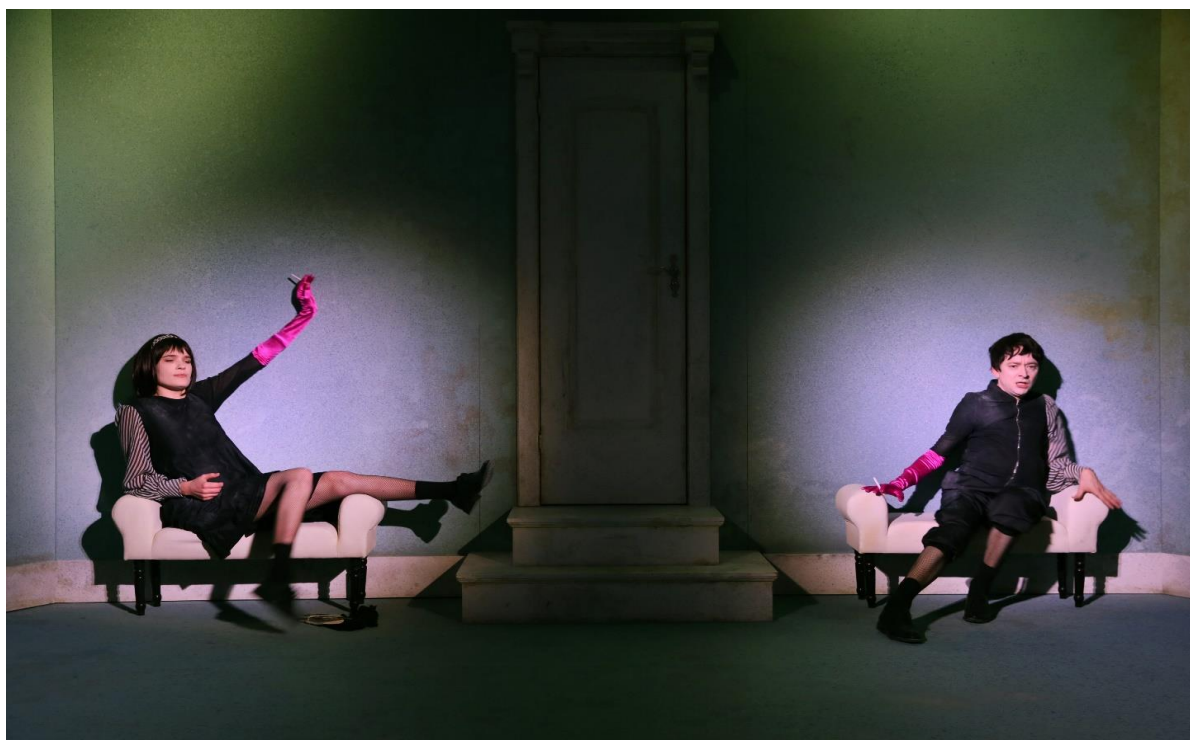
mijn moeder is een diva