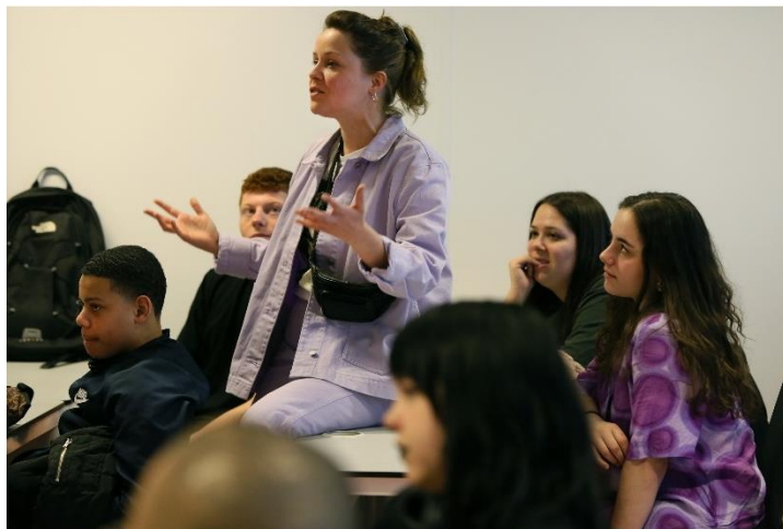
SWEET SIXTEEN © SANNE PEPER

Na afloop van de voorstelling vindt een professioneel geleid nagesprek plaats.