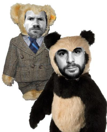
IK ZAG TWEE BEREN © ESTHER DE BOER