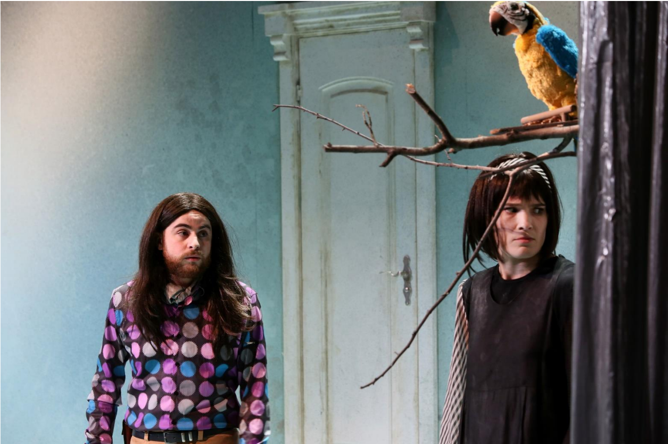
MIJN MOEDER IS EEN DIVA © SANNE PEPPER